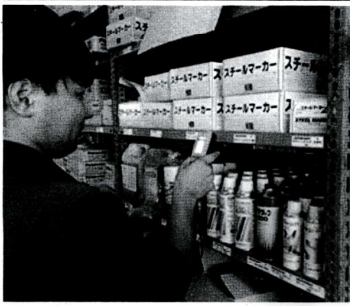
在庫品の管理や棚卸し作業にも ハンディターミナルを活用

ハンディターミナルの導入により、業務効率の向上が実現した。これは、現場での作業効率の向上に大きく貢献している。品田社長は、「ハンディターミナルの導入により、業務効率の向上が実現した。これは、現場での作業効率の向上に大きく貢献している」と話す。